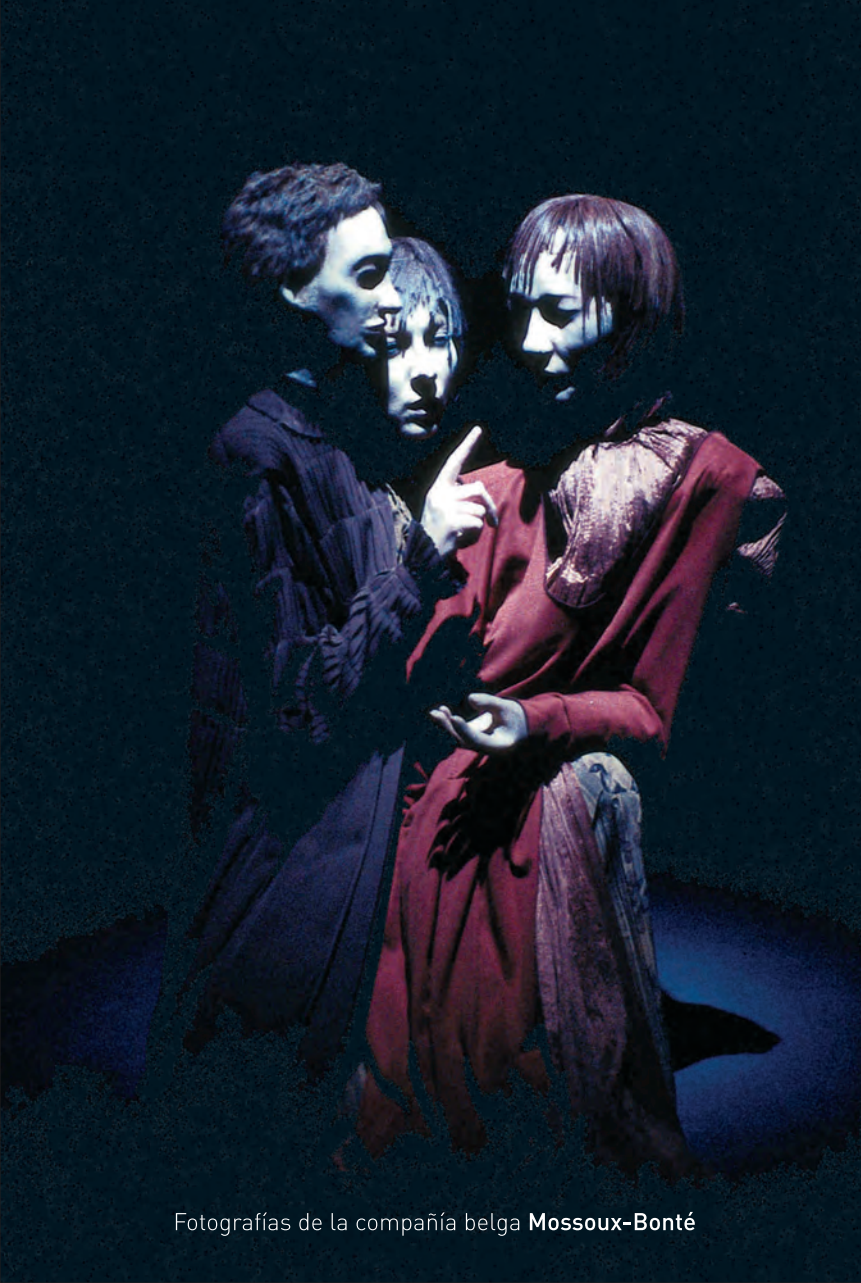
Fotografías de la compañía belga Mossoux-Bonté